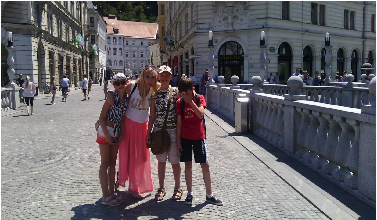
Екскурсія до міста Любляни ( Словенія )