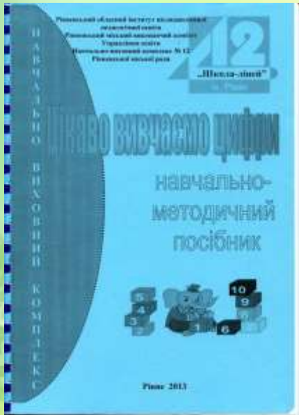
«Цікаво вивчаємо цифри», навчально-методичний посібник

«Вивчення тем «Прикметник» та «Числівник» у почakovій школі»