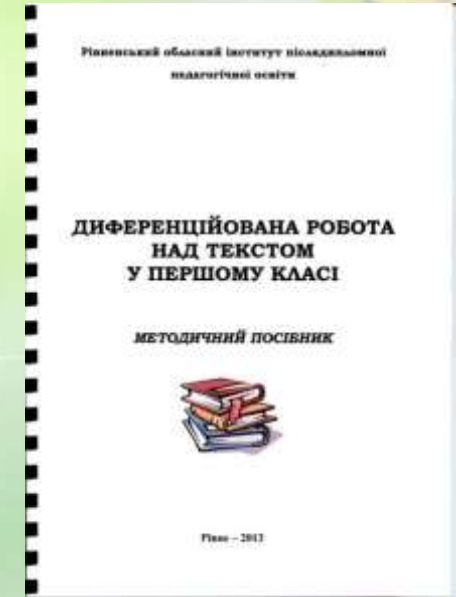
Співавтор методичного посібника «Диференційована робота над текстом у першому класі»