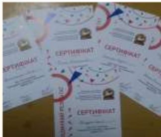
Міжнародний конкурс з інформатики та комп'ютерної вправності «Бобер»