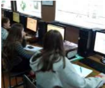
Участь у тестуванні