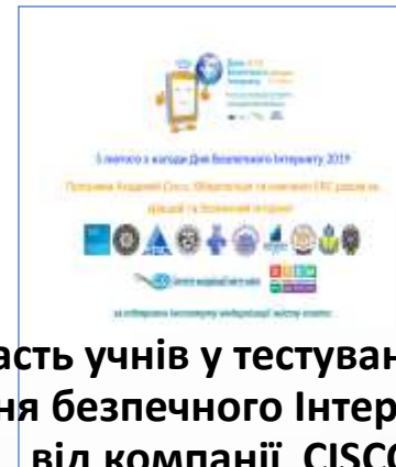
Участь учнів у тестуванні до Дня безпечного Інтернету від компанії CISCO