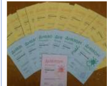
Всеукраїнський конкурс «Безпечний Інтернет»