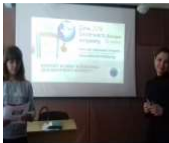
Інтернет: користь чи шкода?