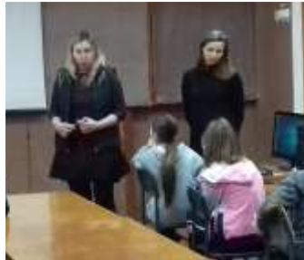
Дискусія «Залежність від Інтернету»