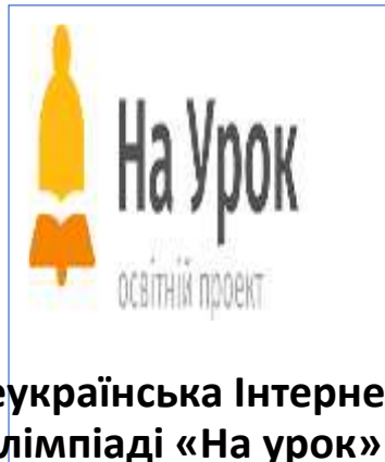
Всеукраїнська Інтернет-олімпіади «На урок»