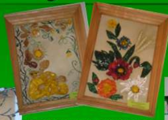
Створюємо декоративні картини (матеріал – солоне тісто).