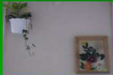
Коридор третього поверху.